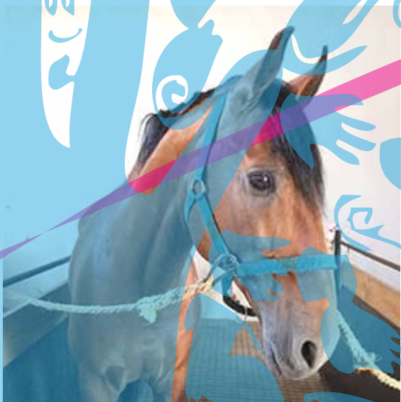
cavalição da Casa Cadaval