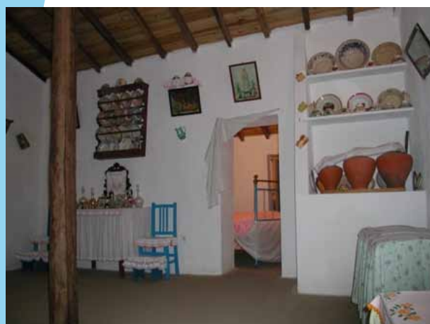
reconstituição de um modelo de habitação da década de 40