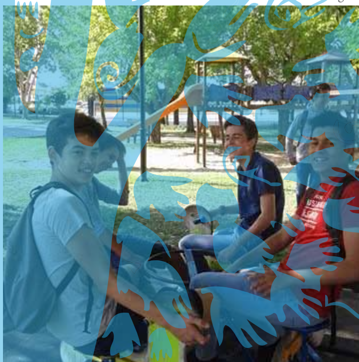
momento de descanso