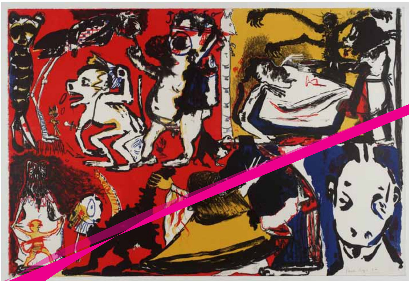
Lessons, 1982 - Litografia sobre papel 105 x 71 cm