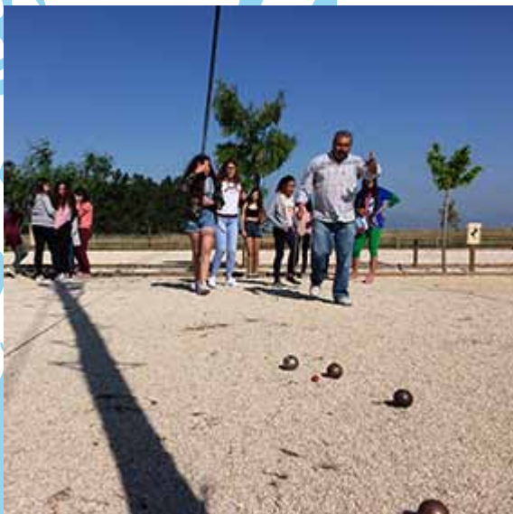
jogando à Petanca