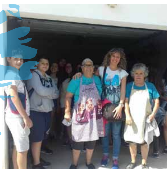
com a população da vila