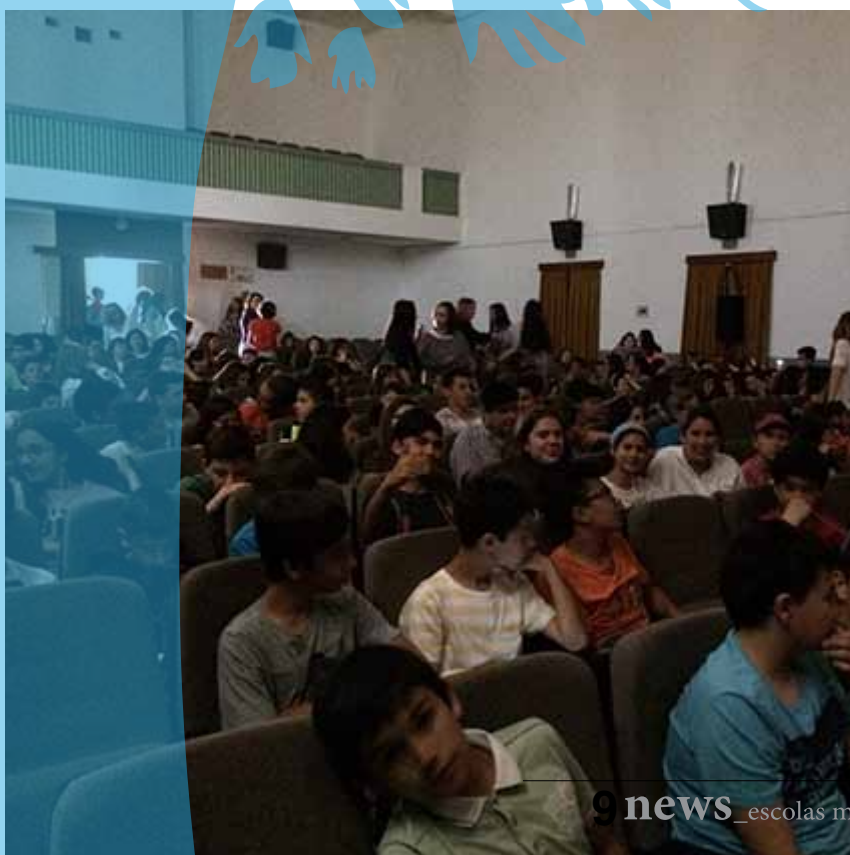
teatro na Casa do Povo de Muge