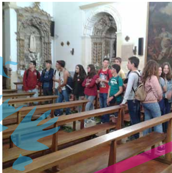
visita à igreja matriz de Muge